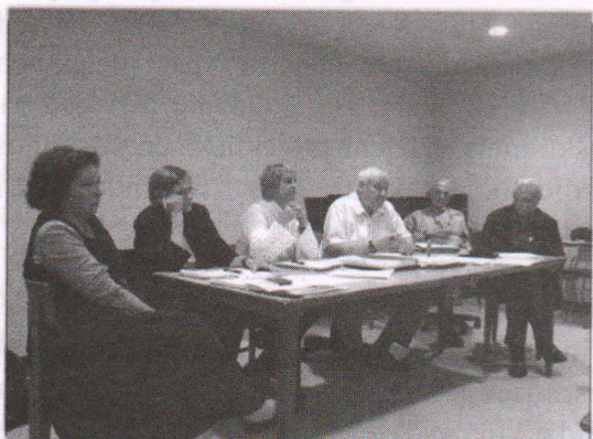
Latviešu Fonda padome novada pilnsapulci Gaŗezera datora istabā.