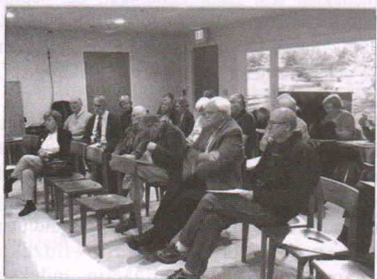
Dalībnieki pilnsapulcē seko darba kārtībai.