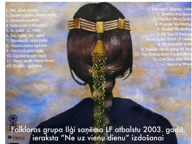
Folkloras grupa Ilģi saņēma LF atbalstu 2003. gadā, ieraksta “Ne uz vienu dienu” izdošanai

“Latviešu Fondam pienākās liela pateicība no 3x3 kustības visā pasaulē, jo ar man piešķirto atbalstu, es varēju 1980. gadā veikt pētījumu par to, kas piesaista un kas atsvešina latviešus no latviešu sabiedrības. Balstoties uz pētījuma rezultātiem, tika radīta 3x3 pamatideja, mērķi, programma un vadlīnijas. Kopš pirmās 3x3 nometnes 1981. gadā Garezerā, ASV, ir notikušas 176 nometnes septiņās valstīs, ar vairāk nekā 26,000 dalībniekiem, kurām joprojām pēc būtības pamatā ir LF atbalstītā pētījuma rezultāti. Paldies LF!”