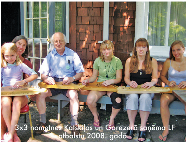
3x3 nometnes Katskiļos un Garezerā saņēma LF atbalstu 2008. gadā.